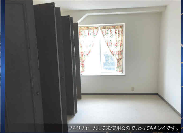
フルリフォームして未使用なので、とってもキレイです。