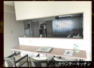
カウンターキッチン