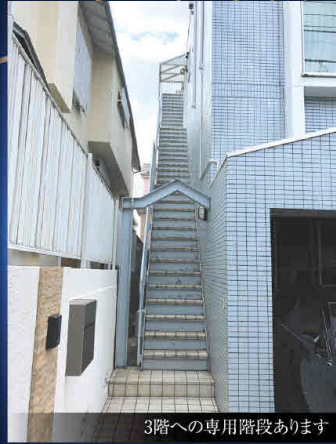
3階への専用階段あります

屋上からは多摩川花火大会が見えます。近くに高い建物がないので見晴らしが良いです。