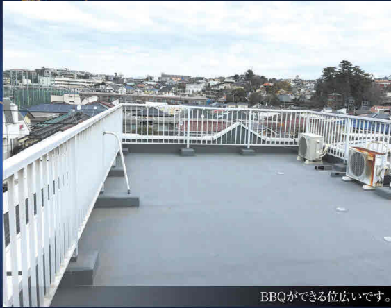
BBQができる位広いです。